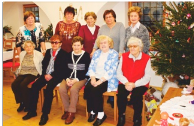
Posezení se seniorkami