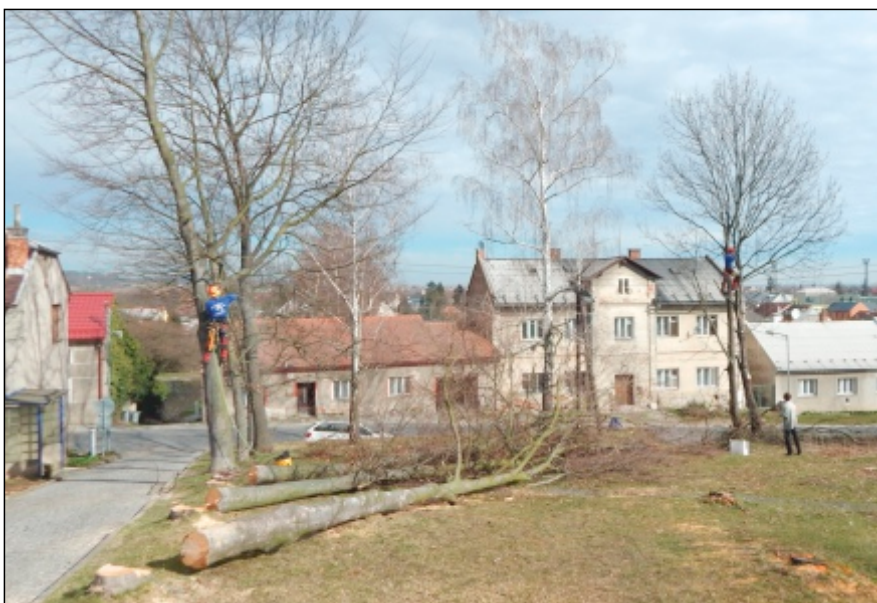
Kácení stromů v parčíku u pomníku padlých v Drahanovicích