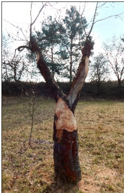
Jabloně ve Střížově