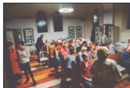
Večírek pro ženy