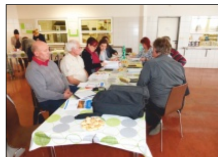
Jednání rady Regionu HANÁ 27. března 2018 v Kostelci na Hané