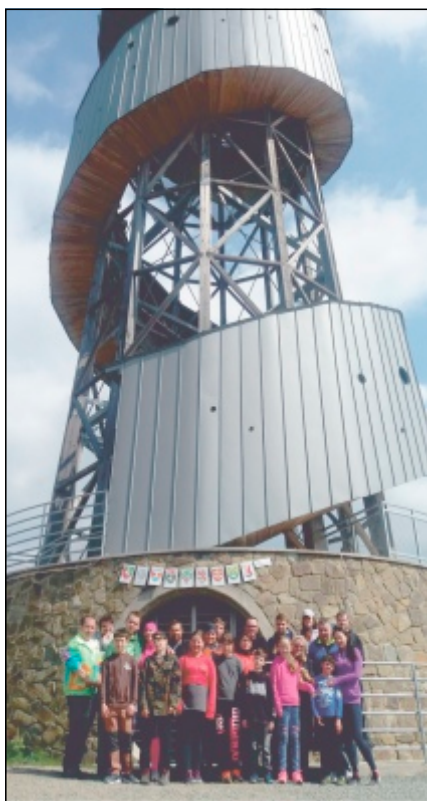
Výšlap na Velký Kosíř