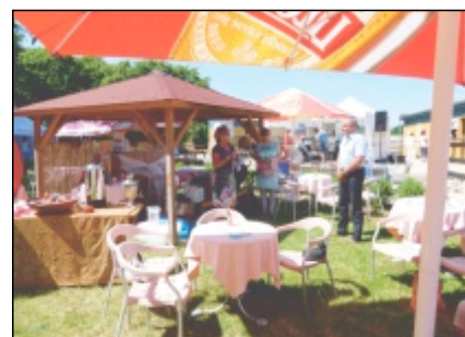
Zahájení Hanáckého cestovatele 3. června 2017 v lázních Slatinice