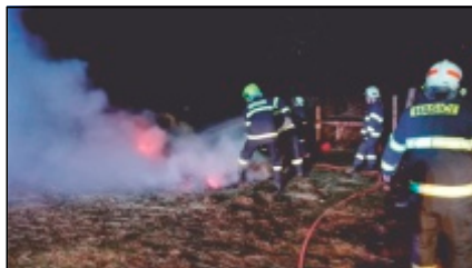
Noční požár sena

Cyklické odborné přípravy velitelů družstev na HZS Olomouc se zúčastnili 4 členové zásahové jednotky SDH Luděřov. Ve dnech 19.3.-23.3.2018 se tři členové JPO Luděřov zúčastnili kurzu „Obsluhovat motorové řetězové pily“ v Jánských Koupelích. Všichni kurz završili úspěšně a to písemnou i ústní zkouškou.