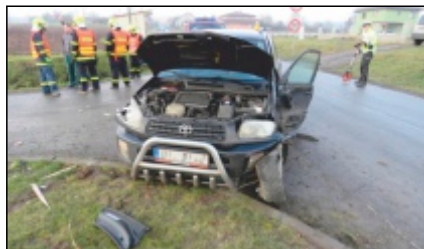
Dopravní nehoda u Kníniček

Brigády byly zaměřeny na kácení suchých stromů a náletových dřevin kolem cesty od pomníku padlých v Luděřově směrem na Příhon a v biokoridoru na louce na Horním poli nad Luděřovem. V současné době probíhá příprava na letní sezónu a na Oslavu patrona hasičů sv. Floriána, která se uskuteční dne 5.5.2018 v Luděřově. Zásahová jednotka SDH Luděřov má na svém kontě letos již 2 výjezdy. 6. ledna 2018 zasahovala při dopravní nehodě osobního automobilu u křižky na rozcestí u Kníniček. 16. března 2018 v nočních hodinách hořelo uskladněné seno na krmení za mostem nad Luděřovem. Požár byl založen úmyslně, neboť celý den přšelo.