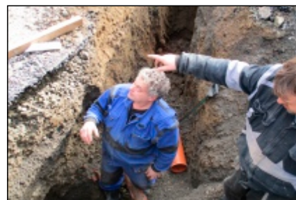
Brigáda na hřišti