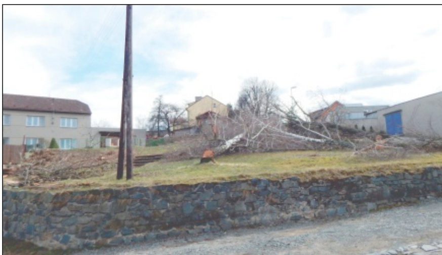
Parčík u pomníku padlých v Drahanovicích