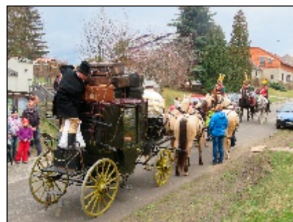
Ze zahájení letošní turistické sezóny

Zastupitelstvo obce také schválilo ve výdajové části rozpočtu prostředky na menší akce jako: Výměnu všech dveří a nákup nového nábytku v kulturním domě ve Střížově, opravu hasičské zbrojnice ve Střížově, výměnu vrat na hasičské zbrojnici v Drahanovicích,