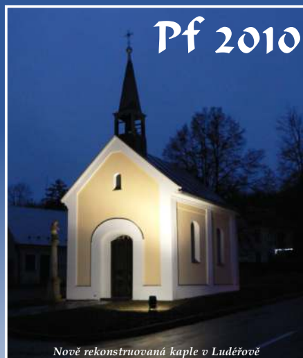
Nově rekonstruovaná kaple v Luděřově

Příjemné prožití vánočních svátků, v novém roce pevné zdraví a mnoho osobních i pracovních úspěchů přeje starosta obce Drahanovice