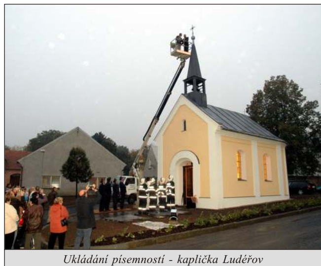
Ukládání písemností - kaplička Luděřov