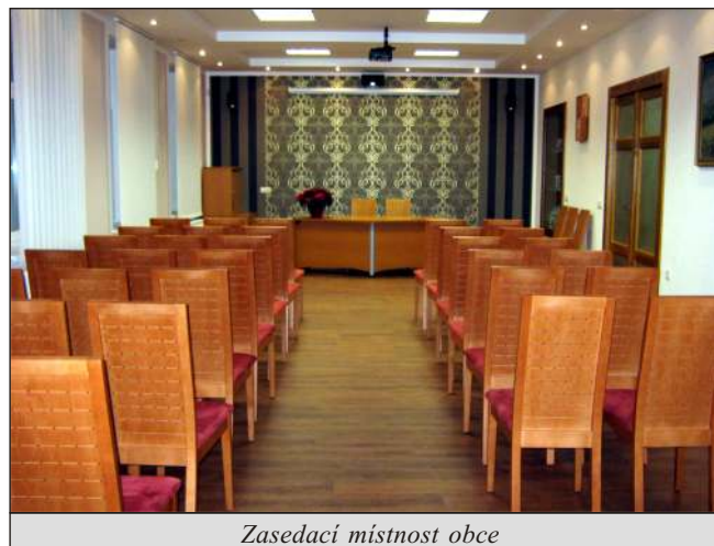
Zasedací místnost obce